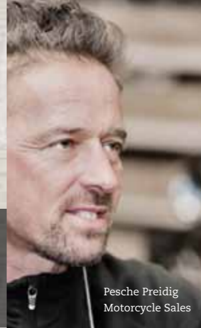
Pesche Preidig Motorcycle Sales

Ein Riesenplus von Harley-Davidson Zürich am Stauffacher ist die absolut zentrale Lage. Sie können Ihr Bike am Morgen bringen und am Nachmittag wieder holen. Ihre Wünsche und Anliegen treffen auf offene Ohren, kluge Köpfe und sehr begabte Hände. Ob für einen Tuning-, Wartungs- oder Reparaturservice: Unser Ersatzteillager ist bereit und unsere bestens ausgebildeten Mechaniker freuen sich leidenschaftlich auf Ihre wunderbare Maschine. Sie tun alles – und das zu fairen Stundenansätzen –, damit jeder noch so kurze oder lange Ride für Sie zu einem unvergleichlichen Vergnügen wird.